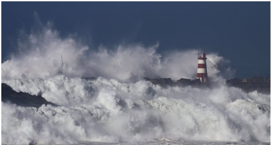
El momento del impacto del oleaje contra las estructuras costeras, es uno de los fenómenos de estudio en ingeniería de costas.