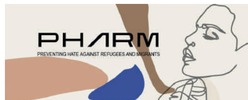
Imagen del proyecto PHARM